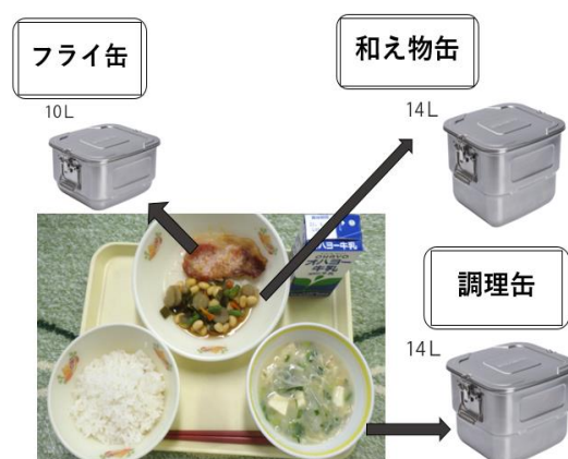
図 1. 学校給食の一例及び対応する食缶

調査対象は、岡山県内の K 市 A 共同調理場にて、2019 年 6 月及び 11 月の給食提供日の 40 日間、1 日 3 献立の献立提供方式を実施し、受配校(小学校 6 校、中学校 14 校)に提供した学校給食献立 120 種類とした。本研究では共同調理場から食缶(調理缶、和え物缶、フライ缶)で配送分配される副食料理のみを扱うこととした(図 1)。